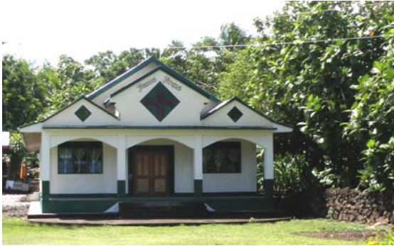
Malumalu – Assembly (AOG)

E iai foi le aoga tulaga-lua (Primary School) o lo o aoga ai alo o le afoaga.