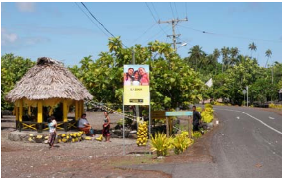
Laufanua o Sasina

E matagofie ma laugatasi lafanua o le afoaga aemaise le itu i sasae se i vagana le itu i sisifo e fai sina maupu'epu'e ma papa. O le a'au pe a ma le 200-250 mita le mamao mai le matafaga i le itu i sasae o le afoaga. O le itu i sisifo o le gataifale e fai si maualuga o papa ma e loloto foi ma pe a ma le 50-100 mita mai le aau. E iai foi vaitaele latalata i le sami o lo o faasimā ma vaaia lelei e tamaita'i i le falekomiti i autafa ane aua o lo o faaaogaina e le afoaga.