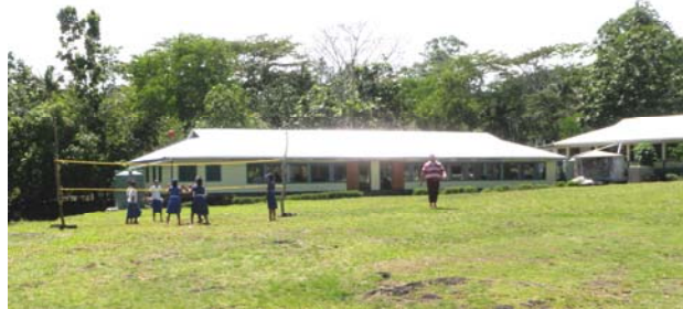
Aoga Tulaga Lua (Primary School)