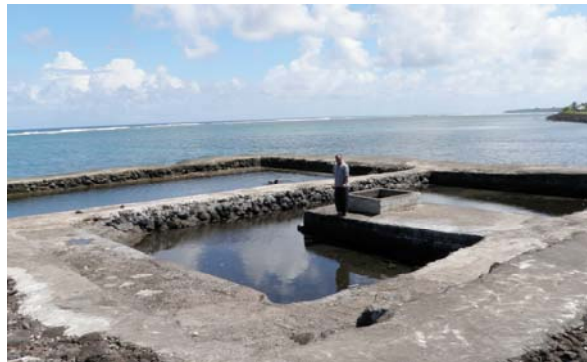
Vaitaele o le afoaga