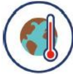
Atténuation et adaptation au changement climatique