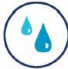
Sécurité de l'approvisionnement en eau