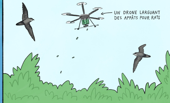
UN DRONE LARGUANT DES APPÂTS POUR RATS

L'éradication des prédateurs sur les îles protège les oiseaux de mer et les tortues qui se reproduisent sur la terre ferme, ce qui favorise également le cycle des nutriments entre la mer et la terre - une victoire pour toutes les espèces marines côtières.