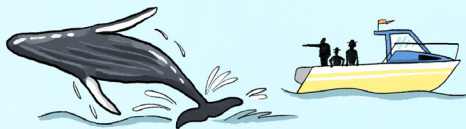
OBSERVATION DES BALEINES ET DES REQUINS

Le nombre d'écotouristes augmente, car des gens du monde entier veulent venir voir les espèces du Pacifique.