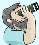
OBSERVATION DES OISEAUX